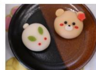
上生菓子(うさぎ、くま)づくり体験