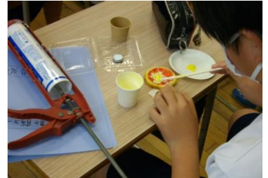
ピザの食品サンプルづくり