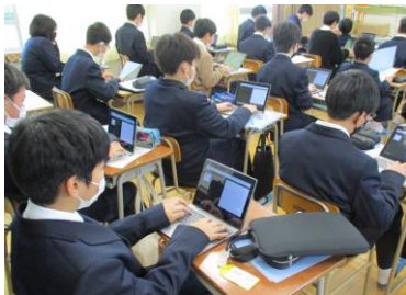
HP制作・アプリ制作体験

HP制作・アプリ制作を通 して、デザインとプログラミ ングの両面(フロントエンド) を学びました！