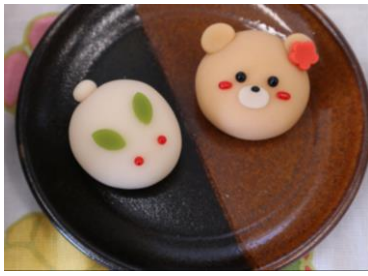
上生菓子(うさぎ、くま)づくり体験