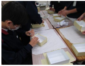
1段タンスの貼り箱制作体験