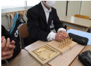
ピンボード演習(大量生産の基礎を学ぶ)

ピンボード演習を通して、 工場などで大量生産をする ときにどんな工夫が必要か考 えました！