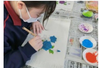
友禅染のランチョンマット製作体験

バラの柄に好きな色を挿し ながら、友禅染の技術をつか ったオリジナルランチョンマ ットをつくりました！