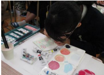
お菓子のパッケージづくり体験