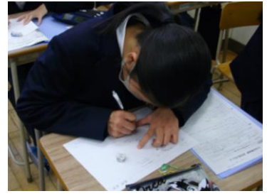
判子のデザインスケッチ体験