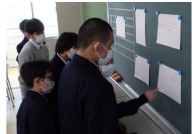
つぶグミのキャッチコピー制作体験