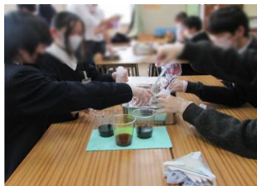
有松絞りのハンカチ製作体験